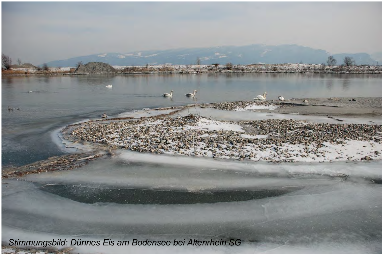
Stimmungsbild: Dünnes Eis am Bodensee bei Altenrhein SG

Der erste Beitrag in der Mitgliederinformation wird immer eine Art Leitartikel zu einem Thema sein, dass sich aus der Vorstandsarbeit ergibt. Der Vorstand kann unmöglich über seine gesamte Arbeit informieren. So müssen vertrauliche Informationen als das auch behandelt werden, Bagatellen hingegen müssen wir nicht aufblasen. Mit dem „Leitartikel“ haben wir dennoch die Möglichkeit, über etwas unverfänglich zu plaudern, oder damit aber auch ganz bewusst eine Diskussion anzuregen.