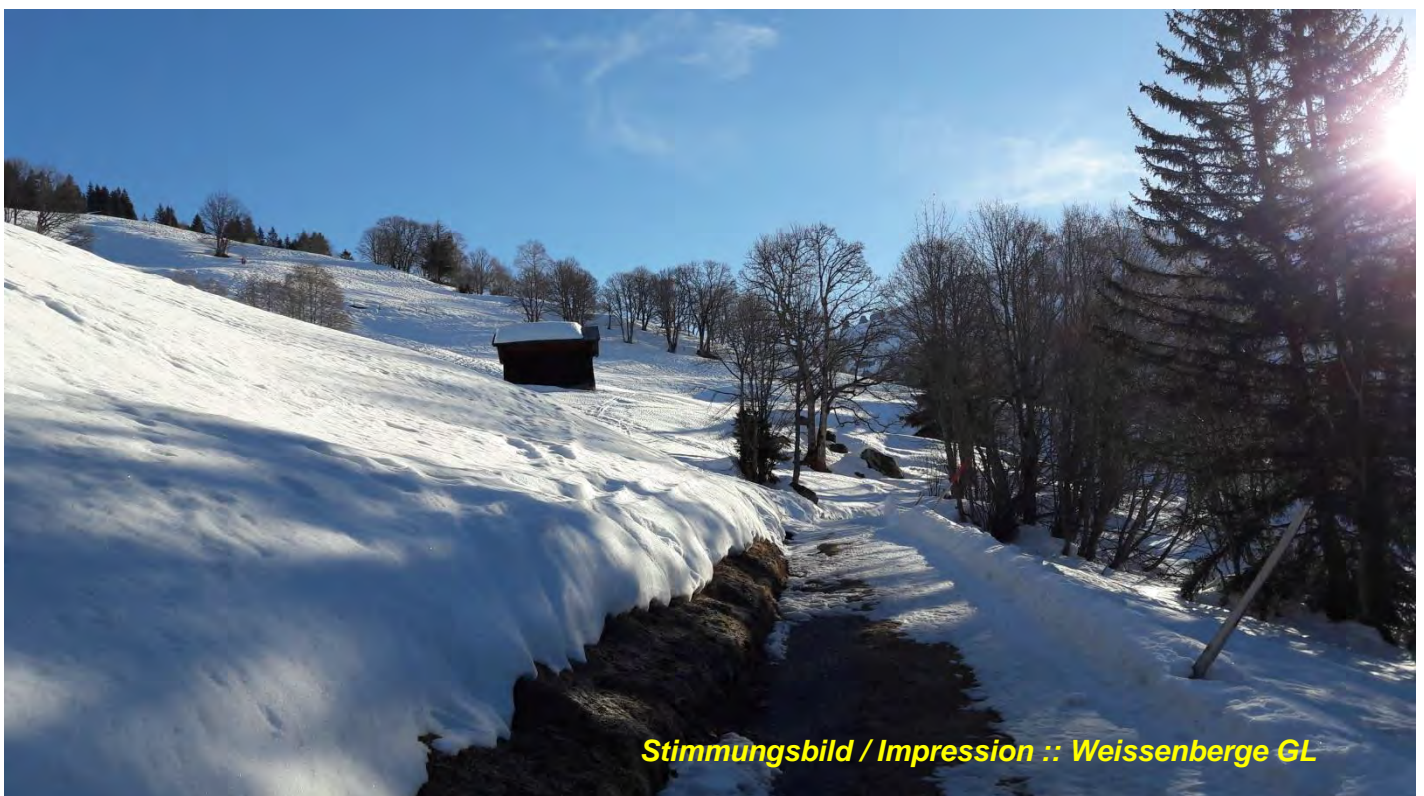
Stimmungsbild / Impression :: Weissenberge GL

Es freut mich, Euch die neue Nummer unserer der VNPS-Informationen zusenden zu können. Neu läuft sie nur noch unter dem französischen Titel „ lettre du trimestre “, einen deutschen Namen gibt es nicht mehr.