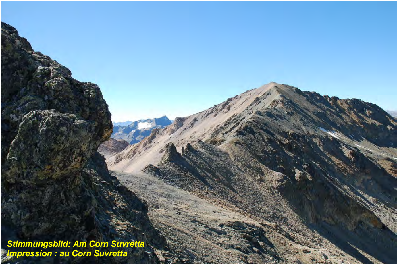
Stimmungsbild: Am Corn Suvretta Impression : au Corn Suvretta