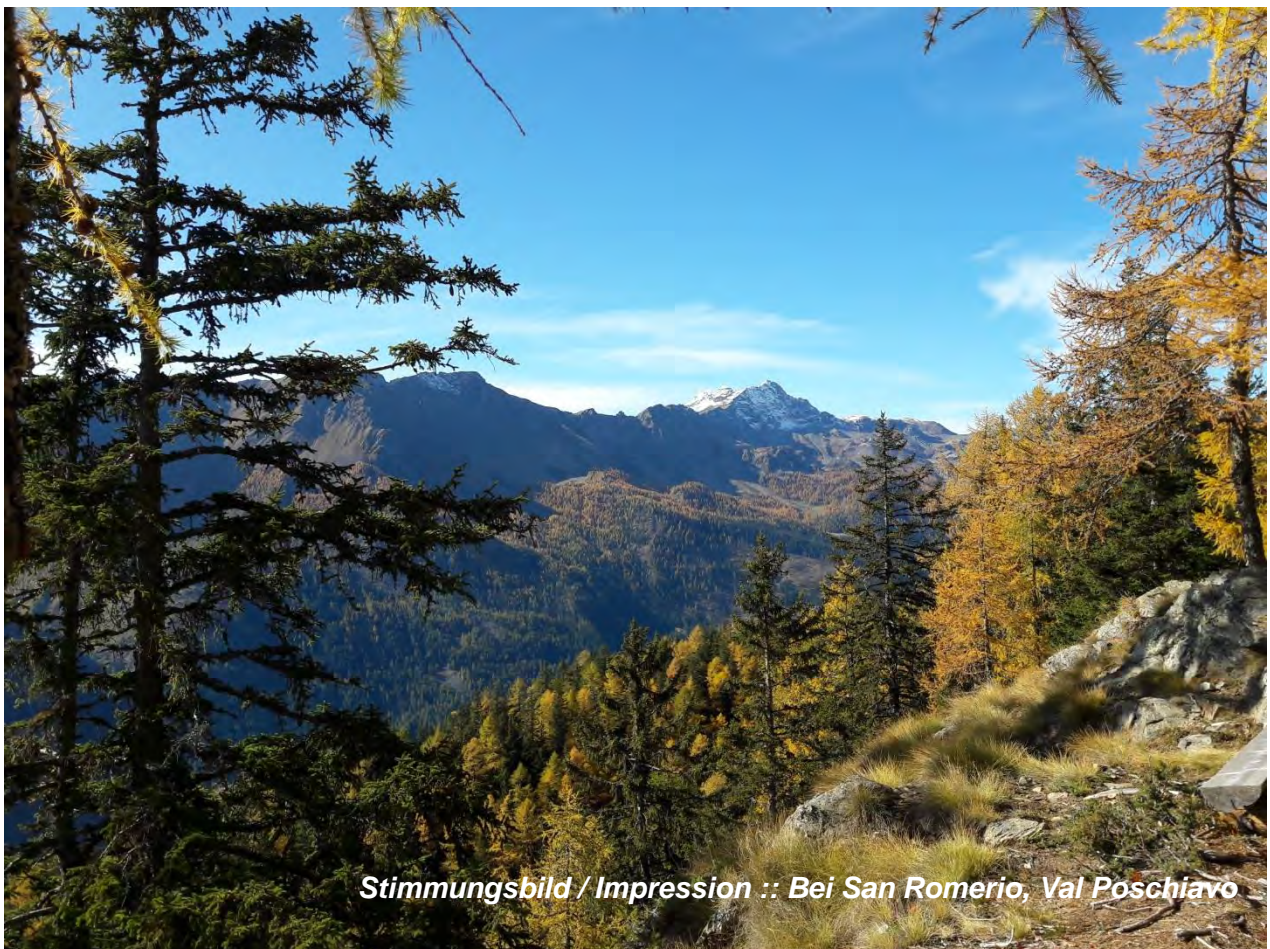
Stimmungsbild / Impression :: Bei San Romerio, Val Poschiavo