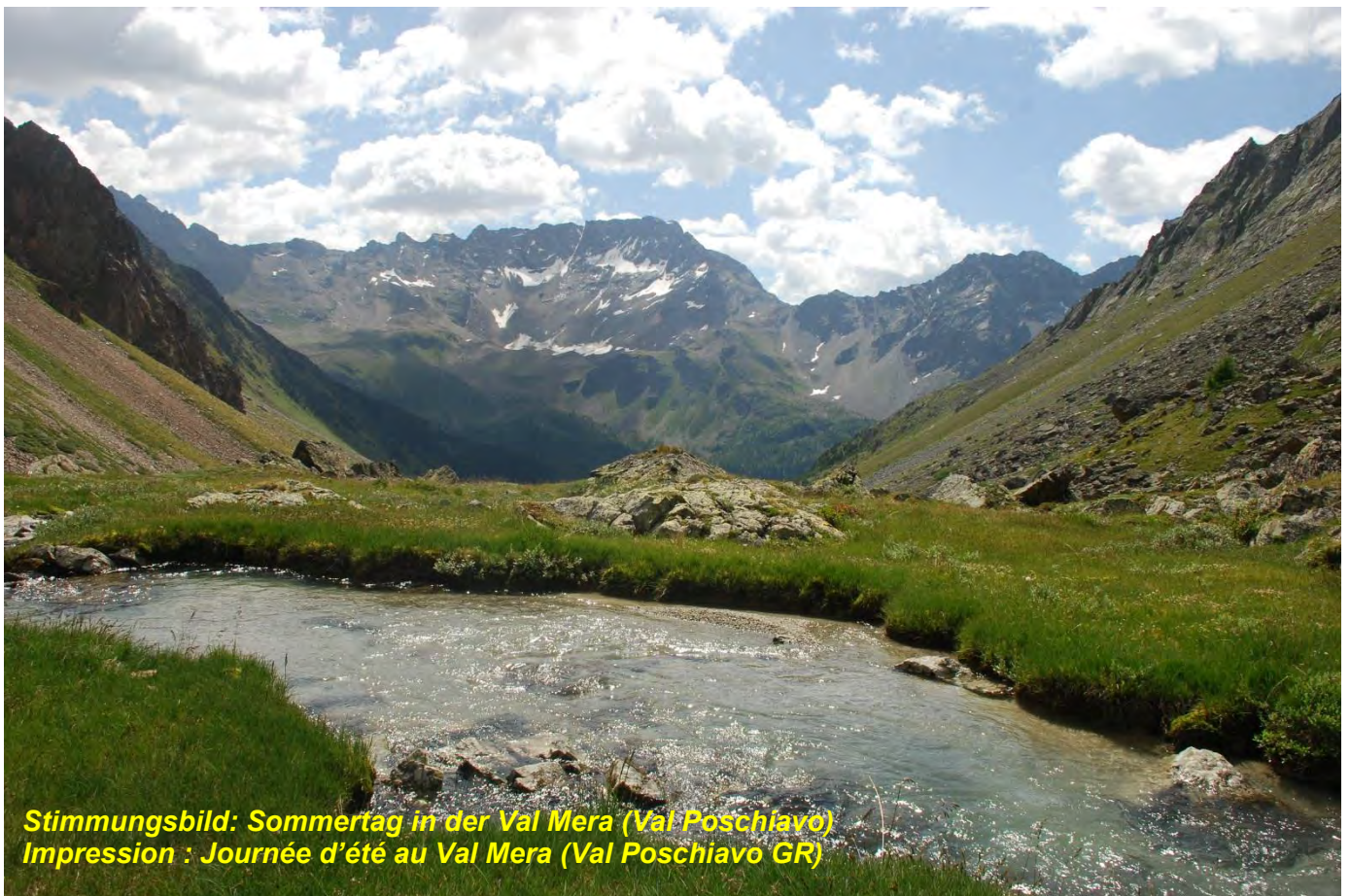
Stimmungsbild: Sommertag in der Val Mera (Val Poschiavo) Impression : Journée d'été au Val Mera (Val Poschiavo GR)