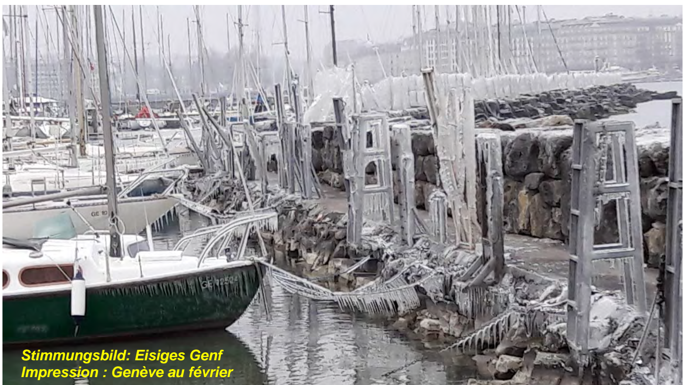
Stimmungsbild: Eisiges Genf Impression : Genève au février

Es freut mich, Euch die neue Nummer unserer der VNPS-Informationen zusenden zu können. Neu läuft sie nur noch unter dem französischen Titel „ lettre du trimestre “, einen deutschen Namen gibt es nicht mehr.